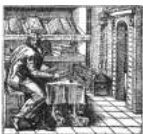
Studium et vita

Gli studenti possono avvalersi della Biblioteca diocesana "P. Bertolla" del Seminario Arcivescovile di Udine, attigua alla sede dell'ISSR Santi Ermagora e Fortunato .